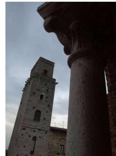
San Gimignano in una foto di Elisabetta Razzi